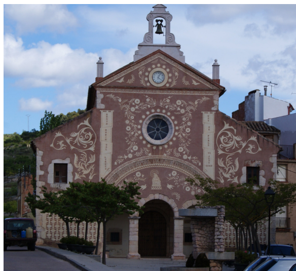
Ulldemolins, El Priorat Catalunya